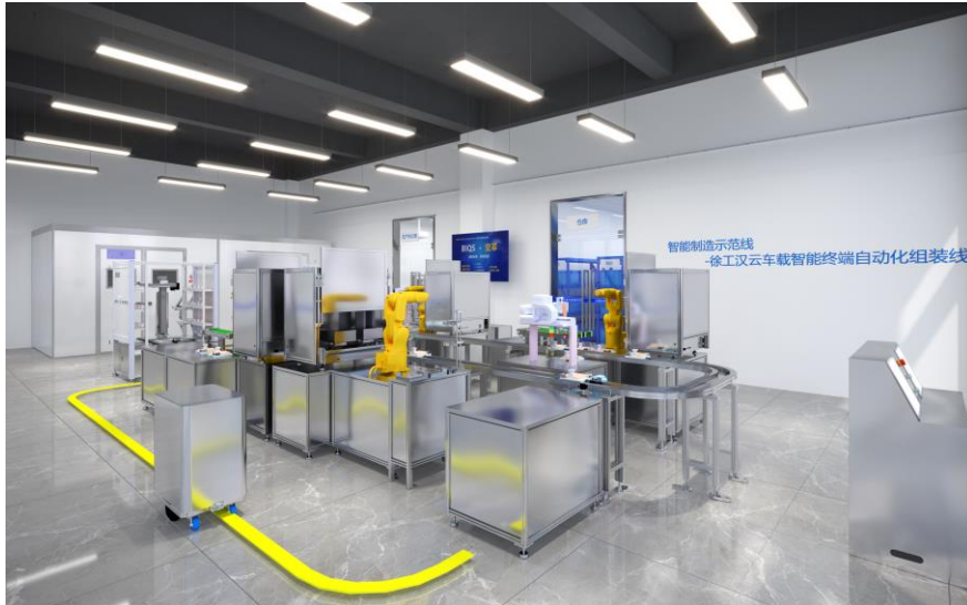
图-4 智能制造实践培训基地

通过教材与师资建设的深入合作，徐工汉云与徐州生物工程职业技术学院信息管理学院共同推动了产教融合的进程。双方通过编写符合行业标准的教材、引入企业导师、开展教师培训和建立评估机制，确保学生能够获得高质量的教育和培训。这一合作模式不仅提升了学生的专业能力，也为地方经济和行业发展提供了强有力的人才支持，推动了工业互联网、人工智能、数字孪生和虚拟现实领域的进步。