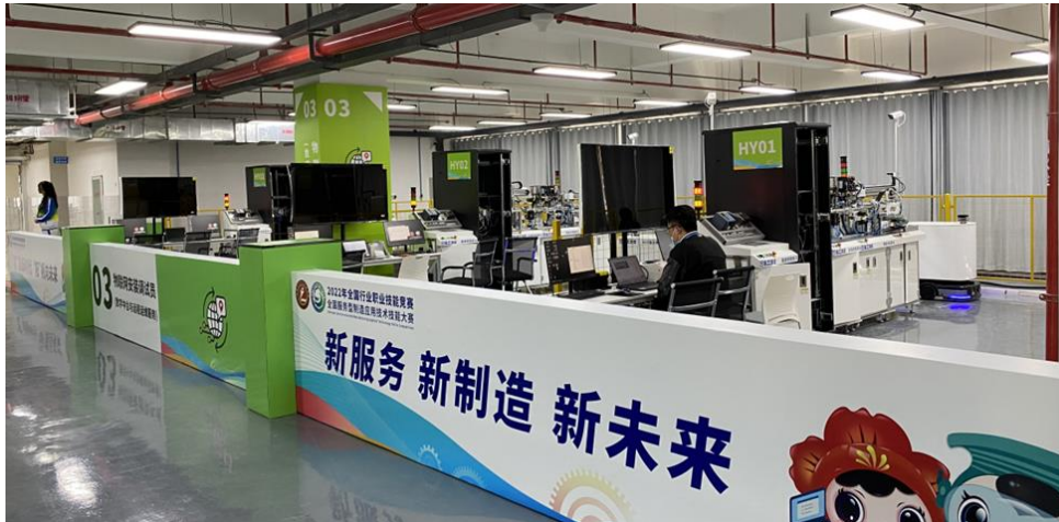
图-1 投身教育，打造“岗-赛-课”一体的教学平台

徐工汉云在高职教育方面也积极发挥作用，致力于培养符合行业需求的高素质技术人才。公司与多所高职院校建立了合作关系，开展校企合作项目，提供实习和就业机会，帮助学生将理论知识与实际操作相结合。此外，徐工汉云还参与制定相关专业的课程标准，推动工程机械领域的职业教育改革，提升教育质量和学生的就业竞争力。公司定期举办技术交流会和职业技能大赛，激励学生的创新意识和实践能力。